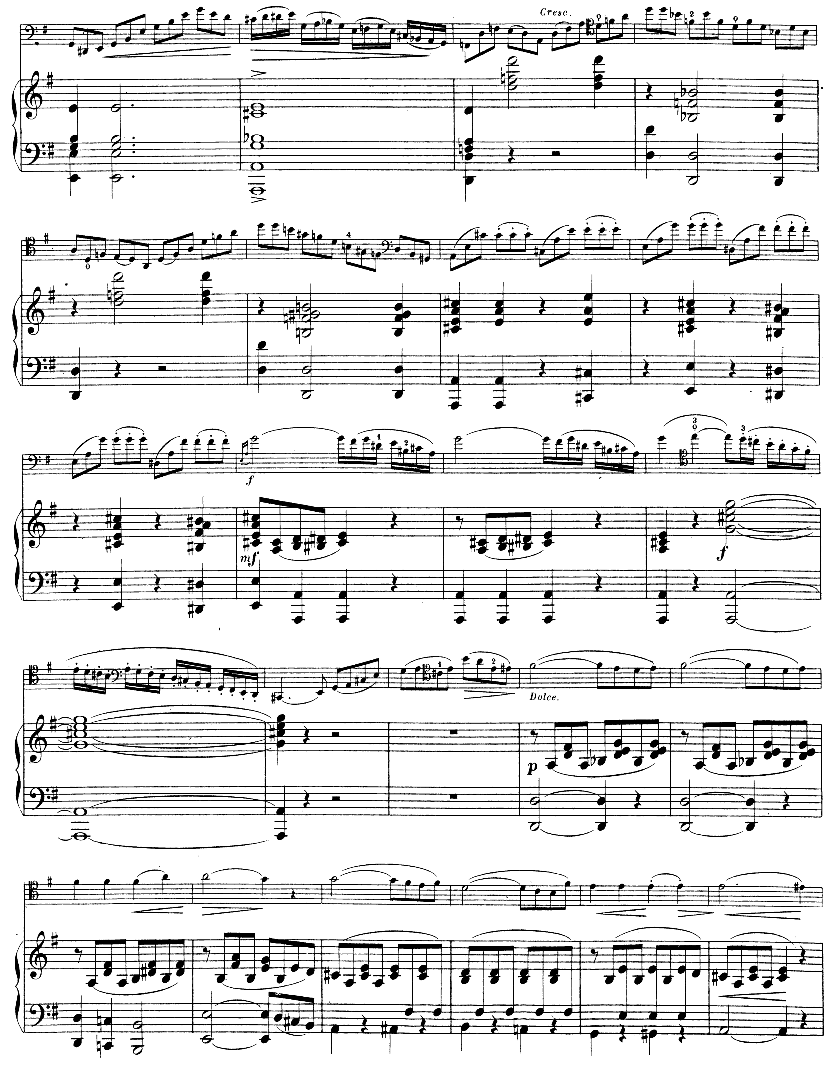
A. L. 8262.