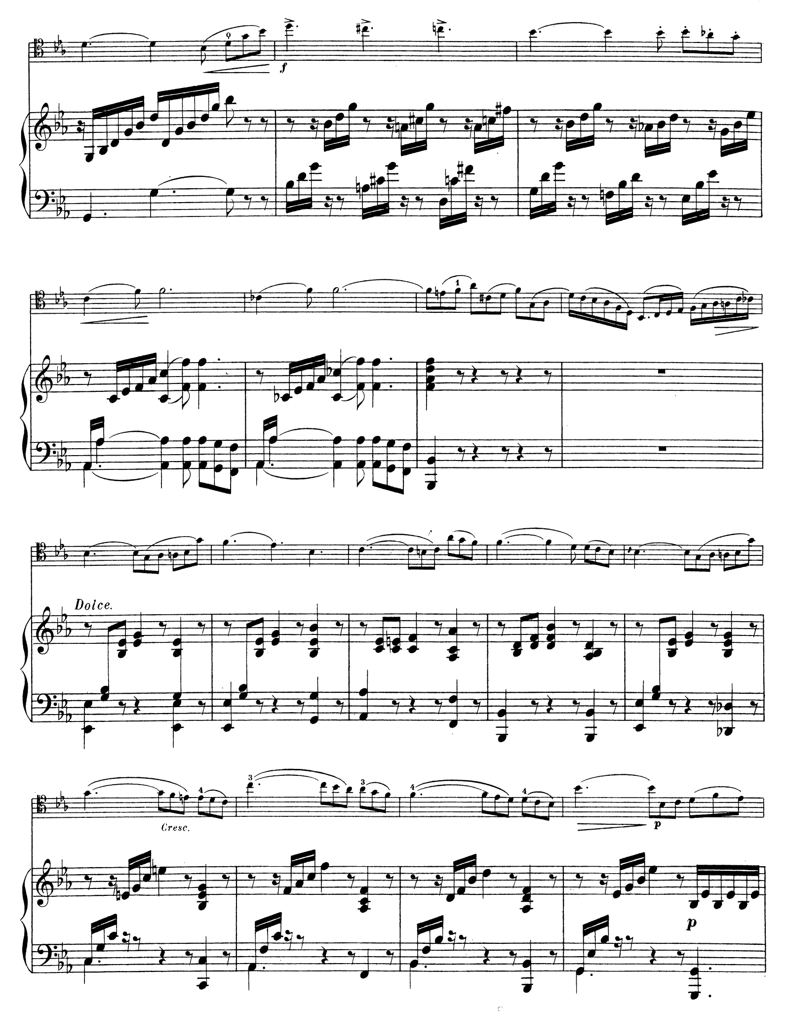
A. L. 8262.