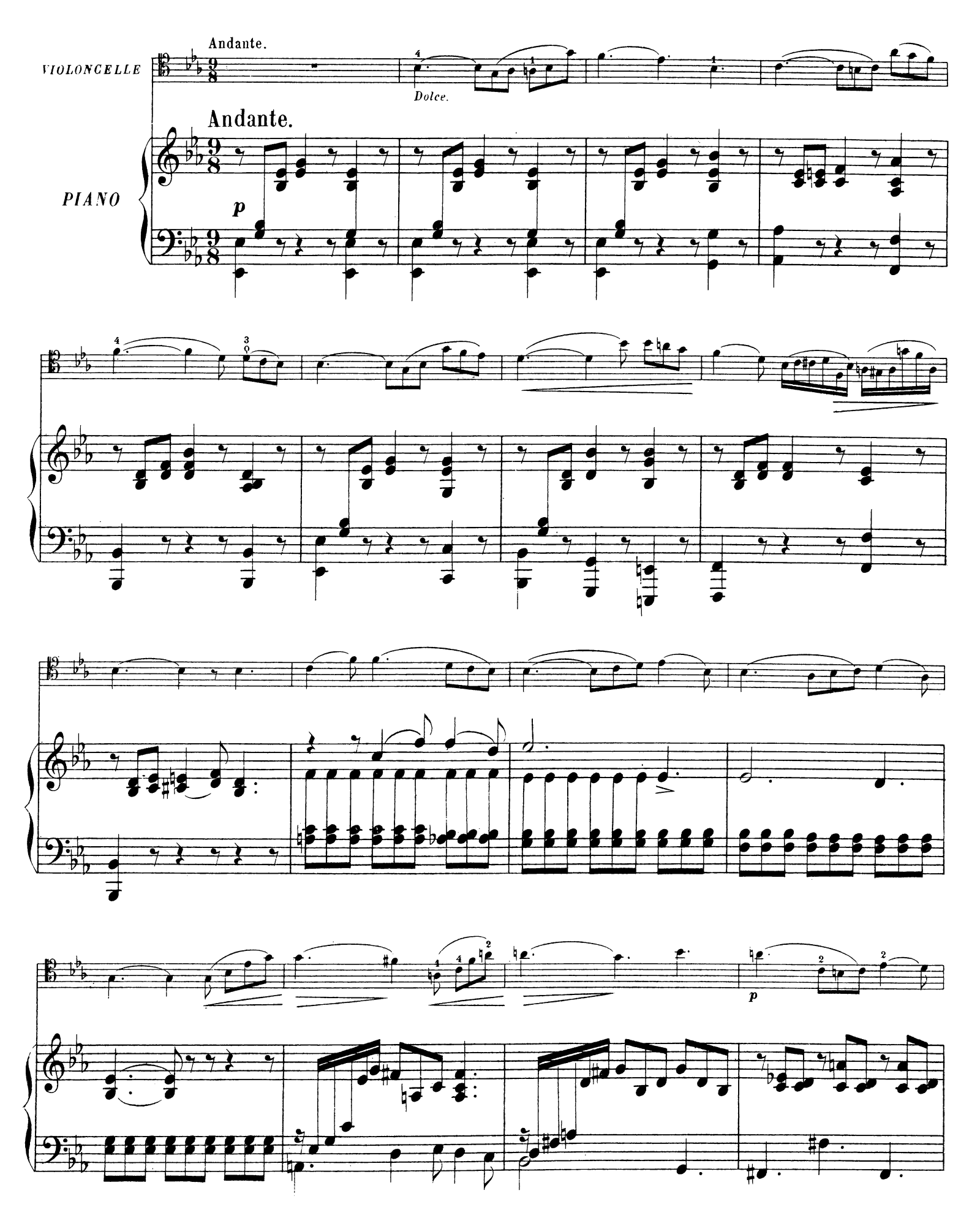
A. L. 8262.