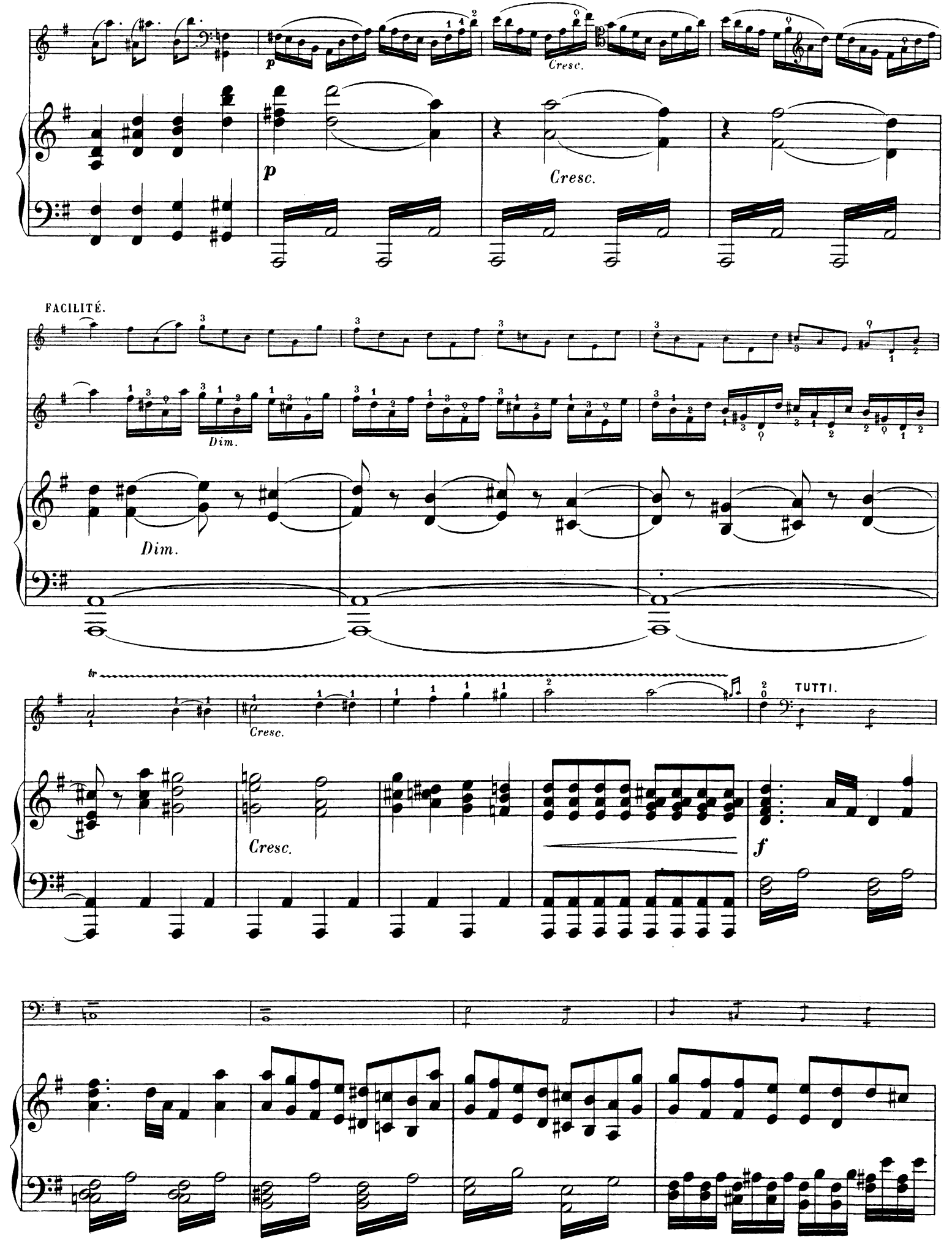
A. L 8262.