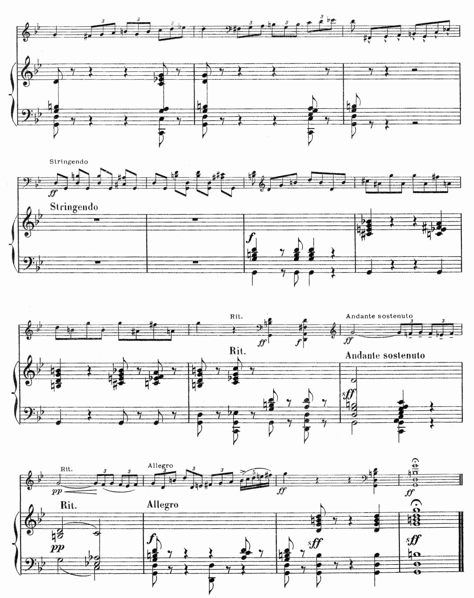
Grav-Imp. CHAIMBAUD & Cie, 20-22, rue de La Tour d'Auvergne, Paris.