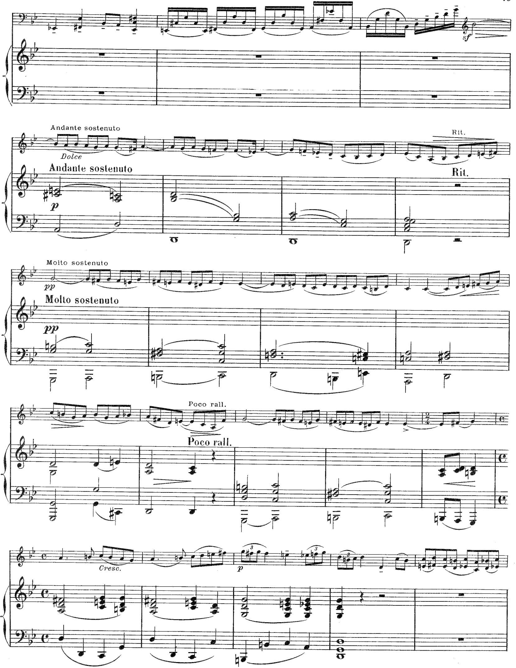
E. 78. M.