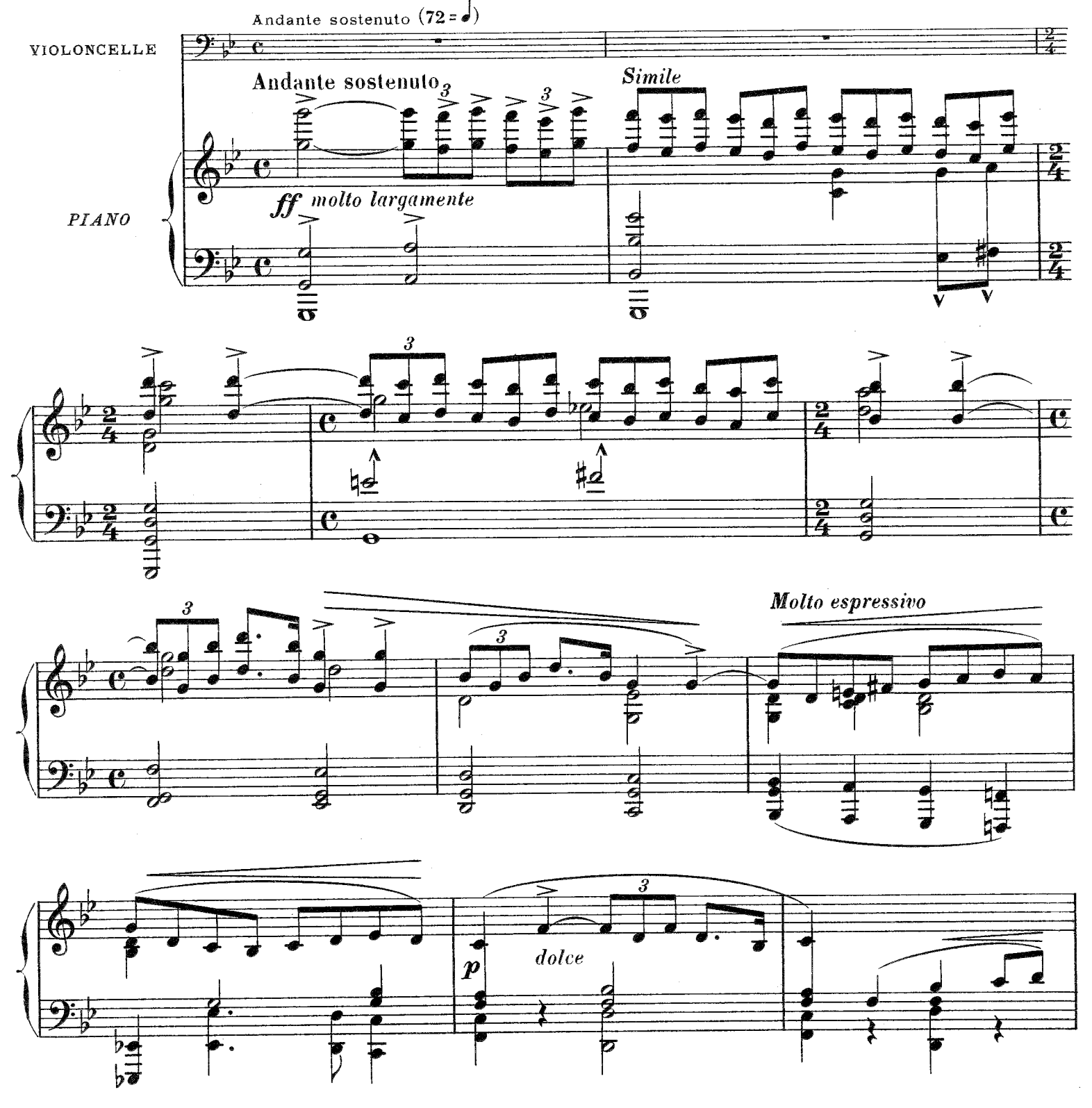
MAX ESCHIG, 13, rue Laffitte, Paris.