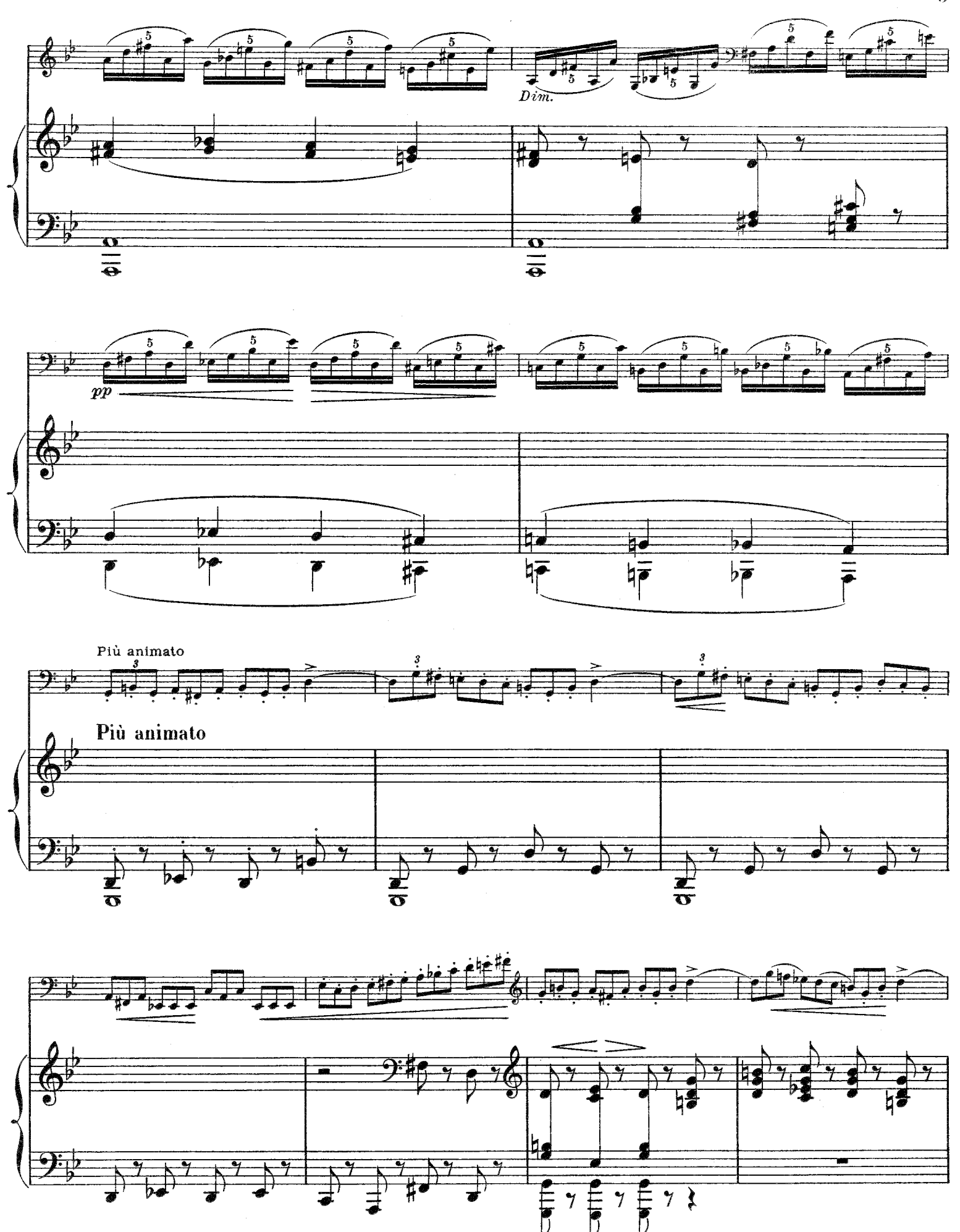
E. 78. M.