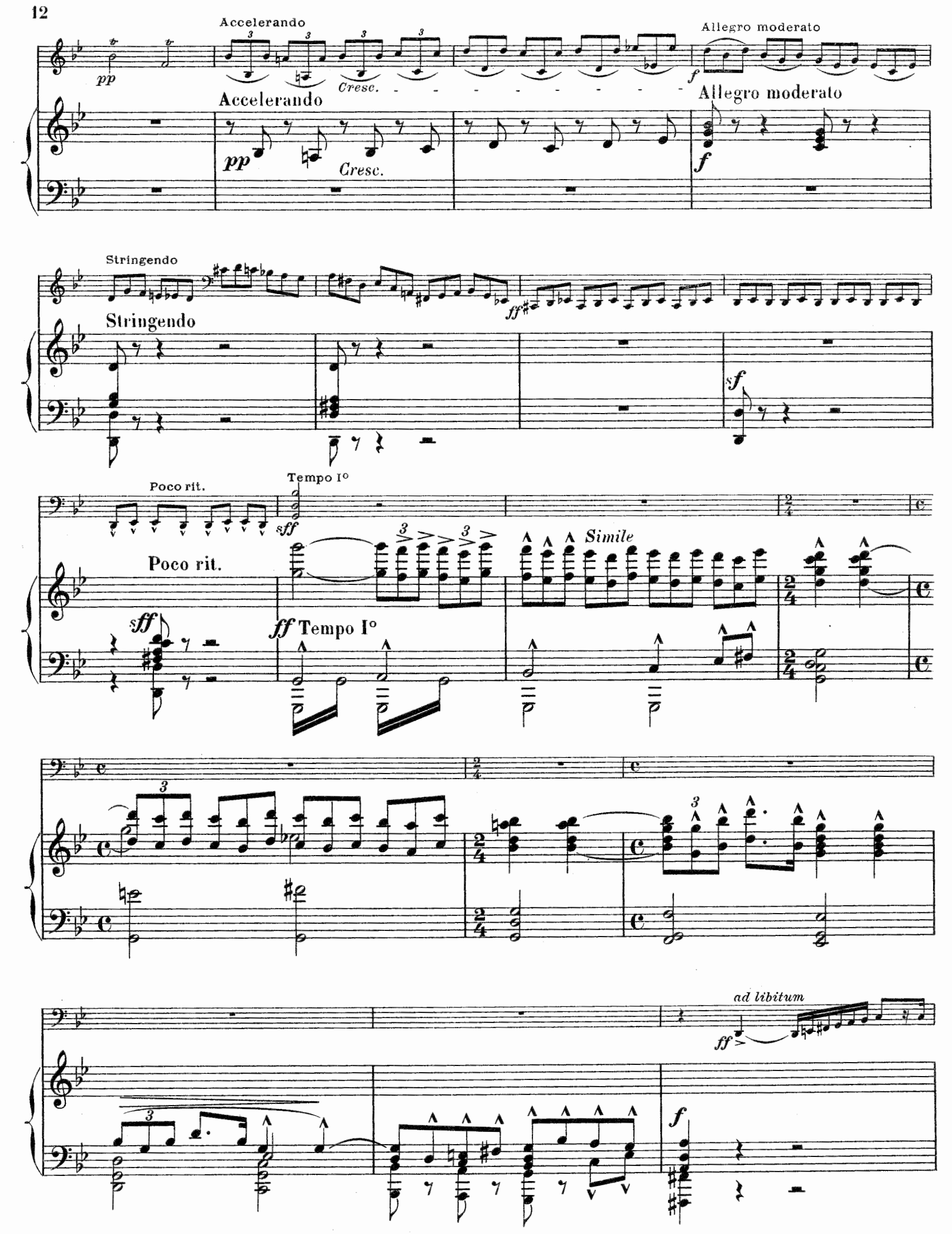
E. 78. M.