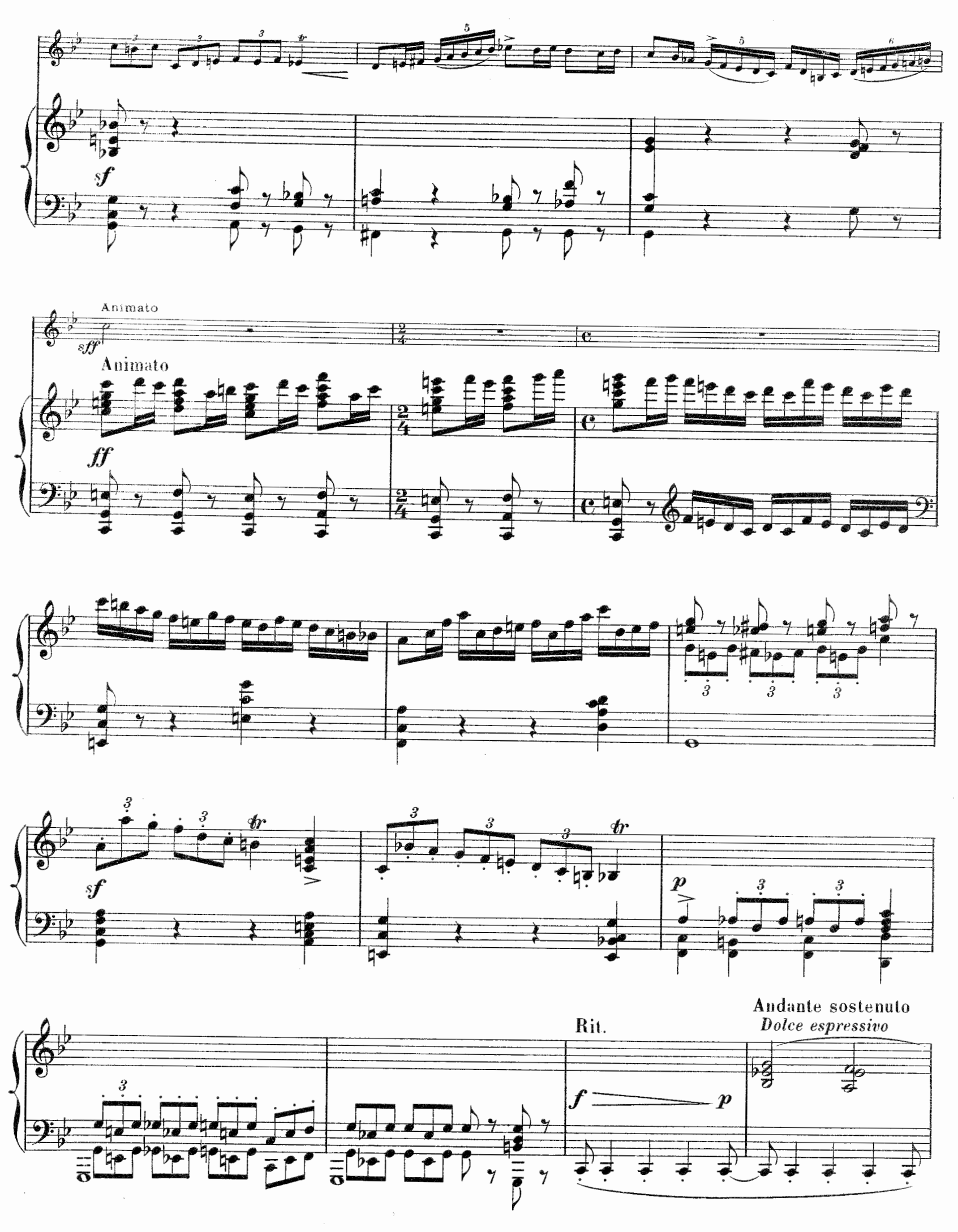
E. 78. M.