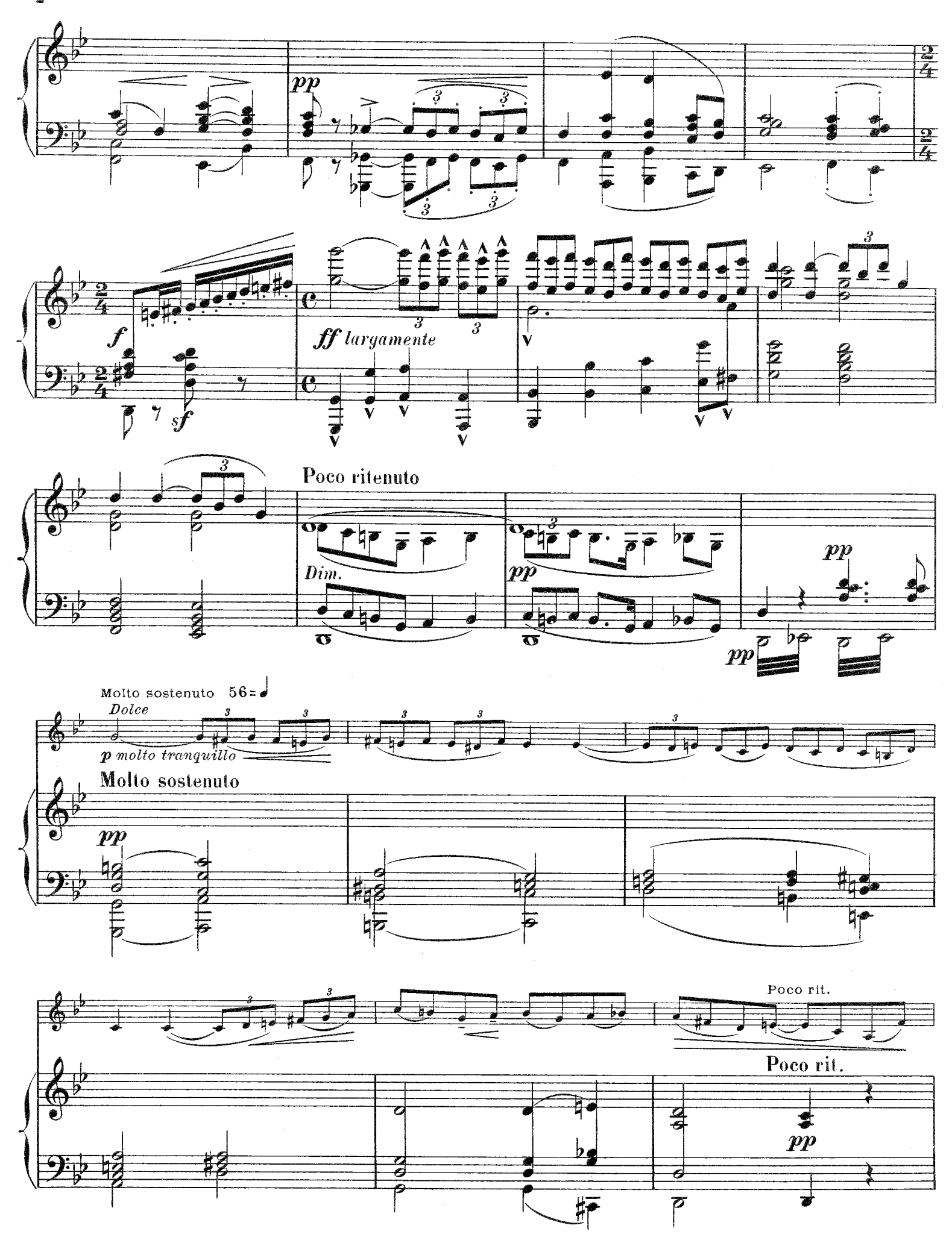
E. 78. M.