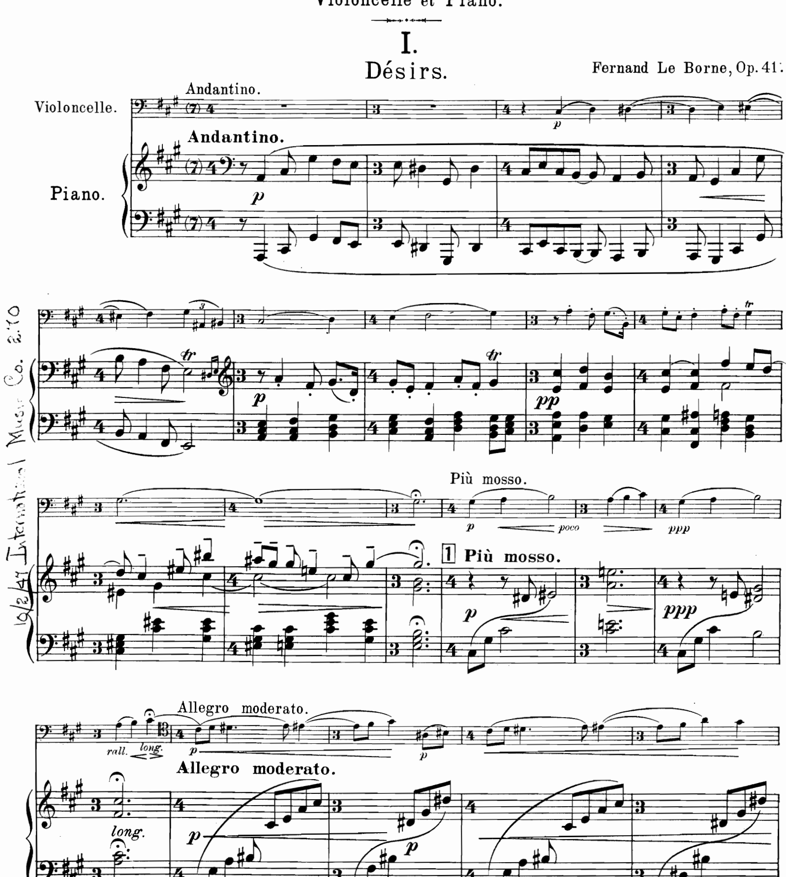
Paris, J. Hamelle, Editeur, 22 Boulevard Malesherbes.