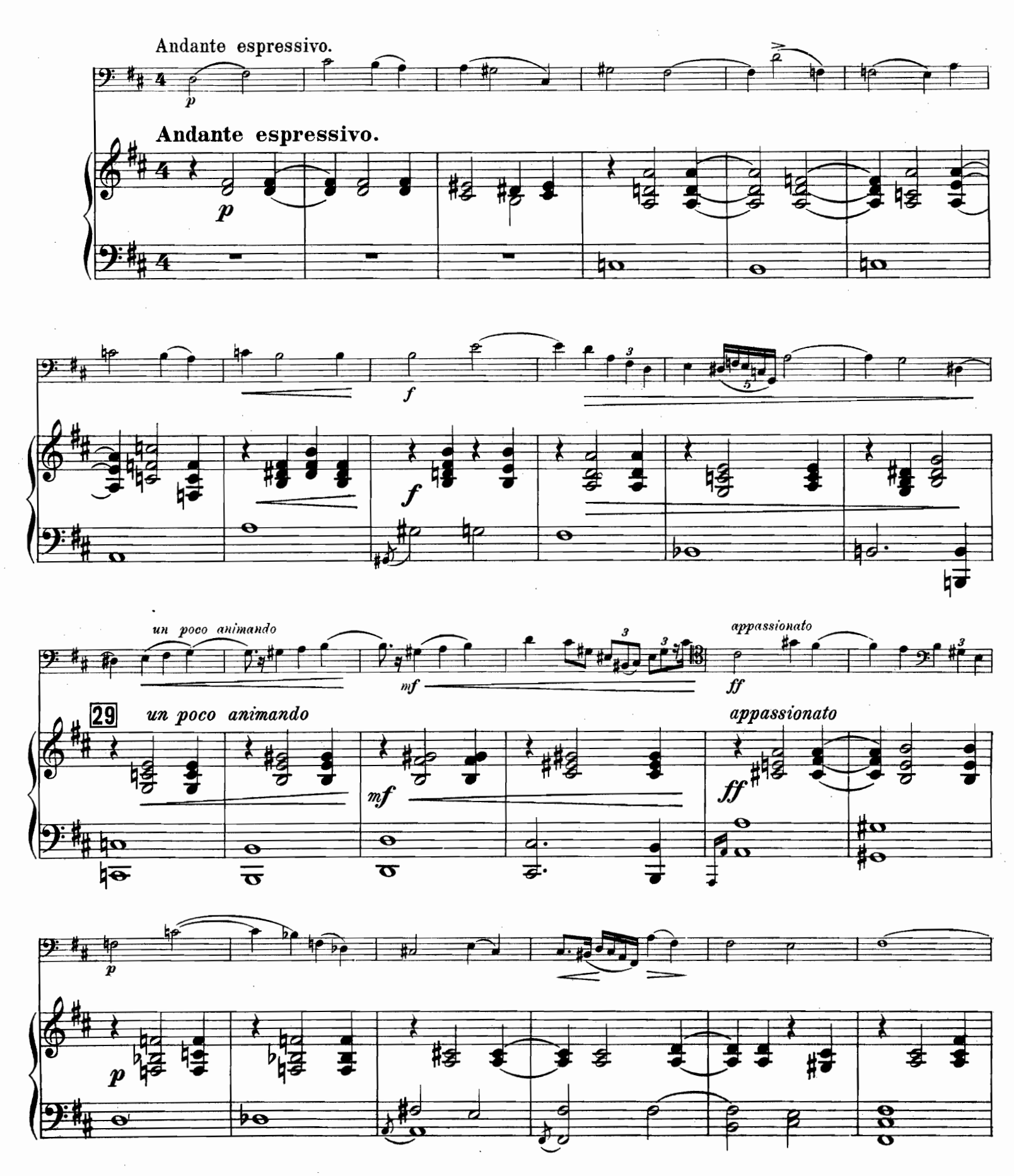
J. 4323 H.