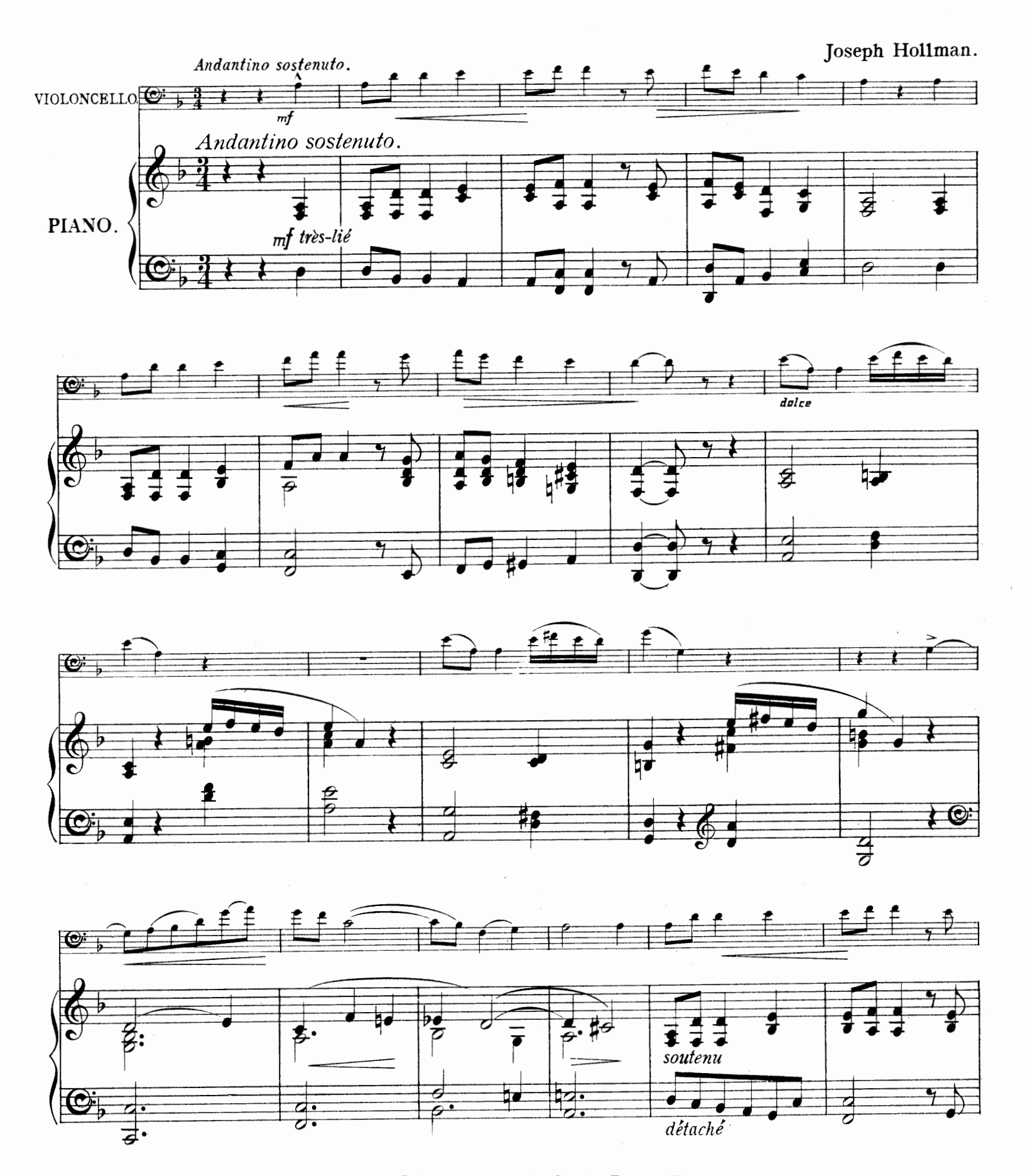
Copyright, 1892, by Novello, Ewer & C?